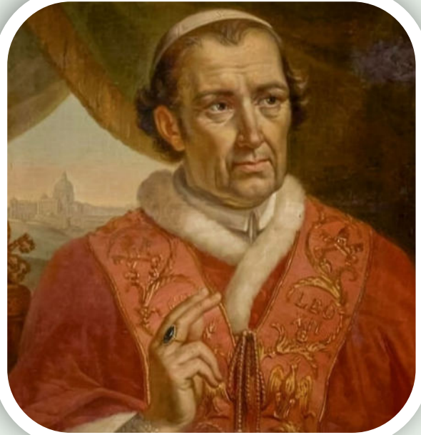
Papst Leo XII. bestätigte am 17. Februar 1826 die Oblaten

Das 3. Generalkapitel (30.09.-02.10.1824 / 11 Kapitulare), das 1824 in Aix gehalten wurde, beschäftigte sich ebenfalls mit der noch reifenden Ordensdisziplin, der missionarischen Sendung und ihrer zeitgemäßen Strategie. Nachdem Papst Leo XII. (1823-1829) am 17. Februar 1826 die Gemeinschaft als Kongregation päpstlichen Rechts unter dem neuen Namen „Missionare Oblaten der Makellosen Jungfrau Maria“ approbiert hatte, wurde das 4. Generalkapitel (10.-13.07.1826 / 12 Kapitulare) in Marseille einberufen. Die revidierte Ordensregel wurde promulgiert. Darin fanden auch die neuen Apostolate Aufnahme, die sich mit den Jahren neben der Volksmission etabliert hatten: Wallfahrtsseelsorge, Leitung von Priesterseminaren und Exerzitien-seelsorge. Die ordenseigene Ausbildung der Oblaten war nun klar gestaffelt in den Einrichtungen von Juniorat, Noviziat und Scholastikat.