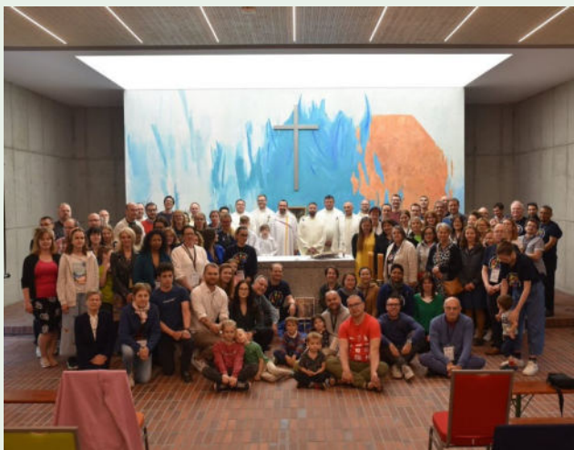
Teilnehmerinnen und Teilnehmer des Treffens in Kokotek

Nun war die Spannung groß, wie die Reaktion der Oblaten auf die Ergebnisse des 20LAC22 sein würde. Als die Kontaktpersonen der 5 OMI-Regionen, sowie eine Vertreterin des frankophonen Afrika und ein Vertreter des zentralen Arbeitsteams (insgesamt 7 Personen) zur Eröffnungsphase des Generalkapitels eingeladen wurden, zeigte sich