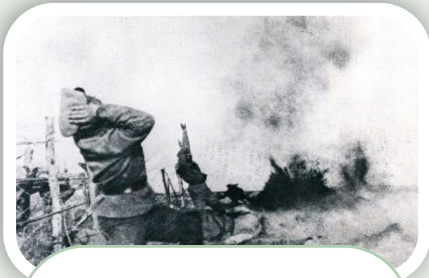
Der Erste Weltkrieg stellte eine besondere Herausforderung für die internationale Gemeinschaft dar

wurde eine dritte Regelrevision (1910-1928) in die Wege geleitet. Ebenso wurden gemäß dem „Statutum pro Missionibus“ von 1919 für Missionsvikariate Obere ernannt, um die Missionare aus der reinen Jurisdiktion der Ortsbischöfe zu entbinden. 1920 wurde der internationale Marianische Missionsverein ins Leben gerufen. Der Erste Weltkrieg (1914-1918) stellte eine besondere Herausforderung für die internationale Gemeinschaft dar. Etwa 600 der 2.250 Oblaten standen unter Waffen. Viele Entwicklungsprozesse und Kontakte wurden blockiert, während die missionarische Arbeit vor Ort weiterging. Erzbischof Augustin Döntenwill stand in Rom zwei weiteren Kapiteln vor: dem 20. Generalkapitel