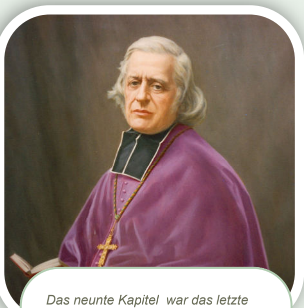
Das neunte Kapitel war das letzte unter dem Vorsitz des hl. Eugen.

Das 9. Generalkapitel (04.-12.08.1856 / 21 Kapitulare) von 1856, das in Montolivet bei Marseille gehalten wurde, war das letzte Kapitel unter dem Vorsitz des Stifters. 1861, beim Tod des hl. Eugen von Mazenod, wirkten 415 Oblate aus 10 Nationen in 8 Ländern auf 5 Kontinenten. Die Gemeinschaft war international etabliert.