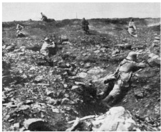
Französischer Angriff auf deutsche Stellungen, Flandern 1917.