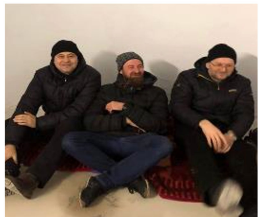
Oblaten während eines Fliegeralarms in Kiew.

Die Ursachen für den Krieg sind zweifellos sehr komplex. Da sind jahrhundertalte historisch-ethnische Komponenten, da sind die ideologischen russischen Territorialansprüche, da ist eine offenbar nicht zu Ende gedachte Ausgleichspolitik der Großmächte nach dem