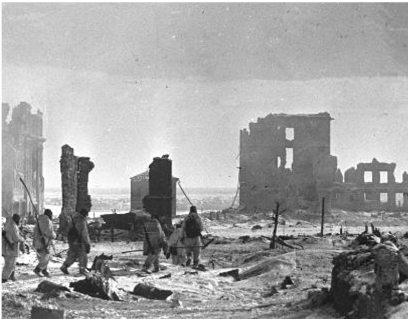
Stadtzentrum von Stalingrad im Februar 1943.

Auch die Gemeinschaft der Oblaten hatte solche Opfer zu beklagen. Von den 327 zum Wehrdienst eingezo-