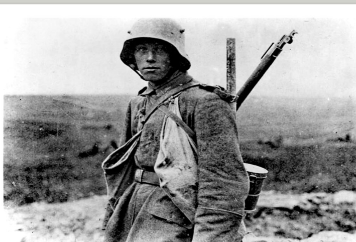
Deutscher Soldat im Jahr 1916.

Seit dem Kulturkampf von 1870 galt die Bevölkerungsminderheit der Katholiken im Deutschen Kaiserreich als „Bürger zweiter Klasse“. Im Krieg, so meinten nicht wenige Katholiken, könnte